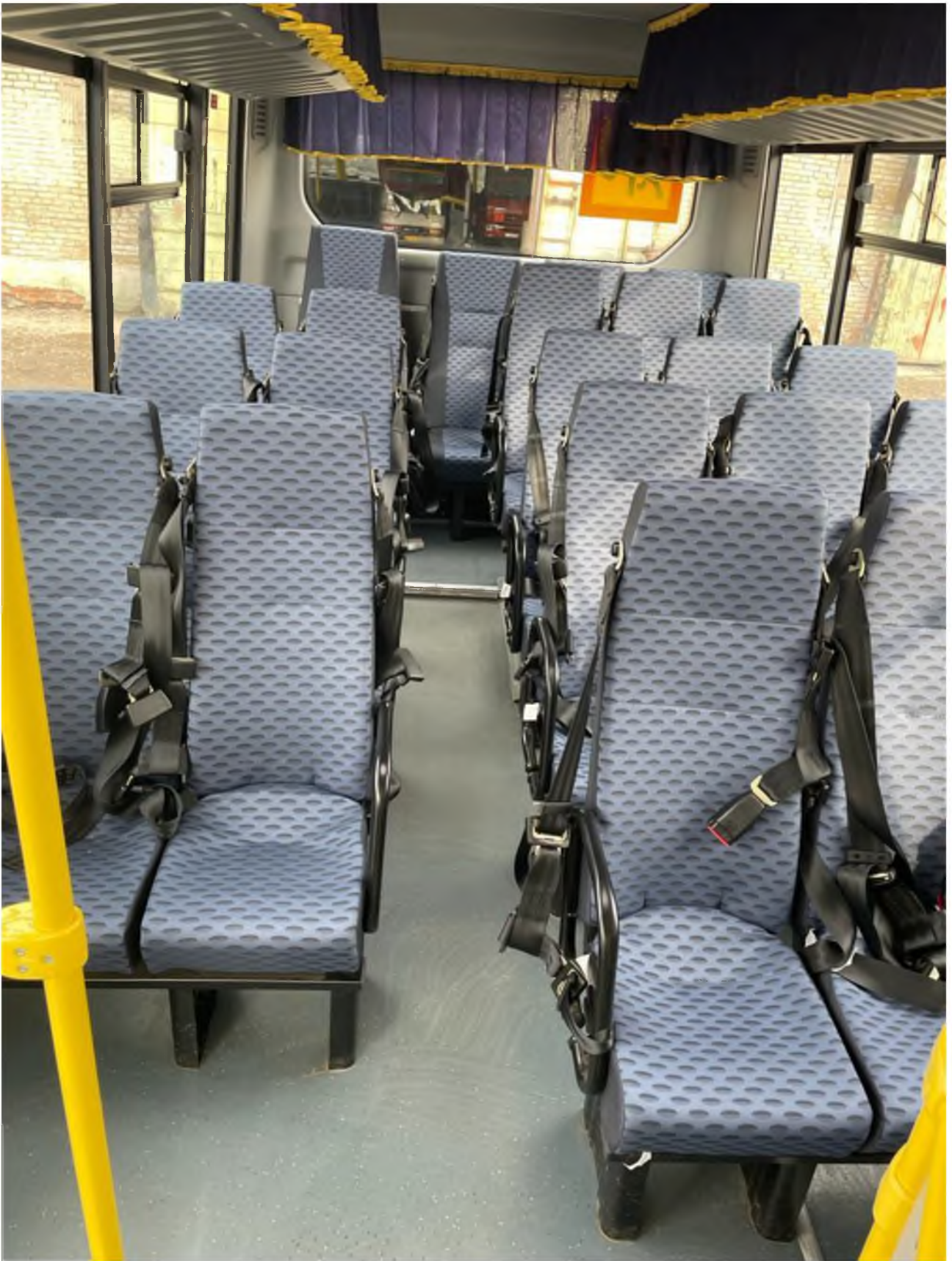
Обзорная фотография салона с крайних передних точек