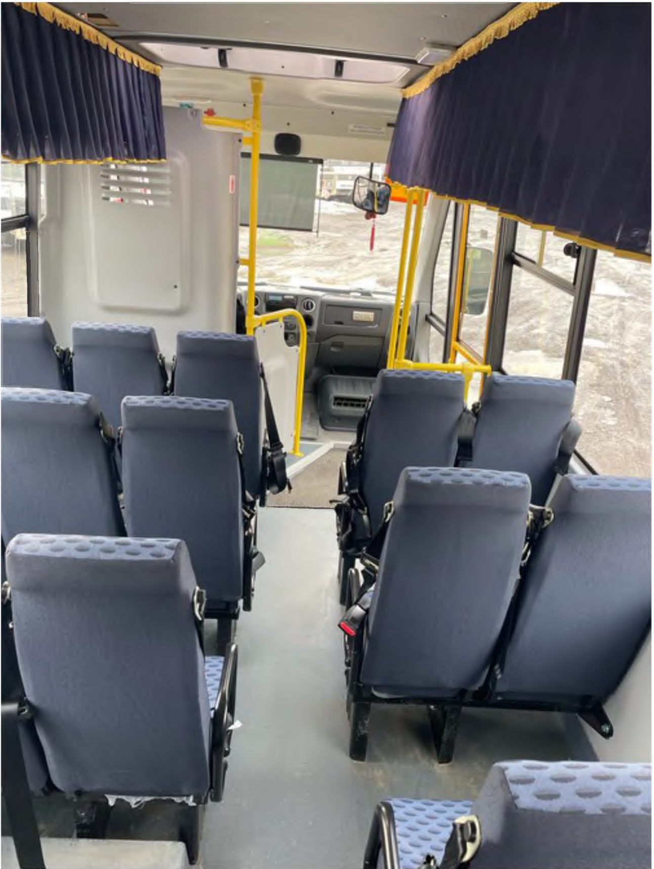
Обзорная фотография салона с крайних задних точек