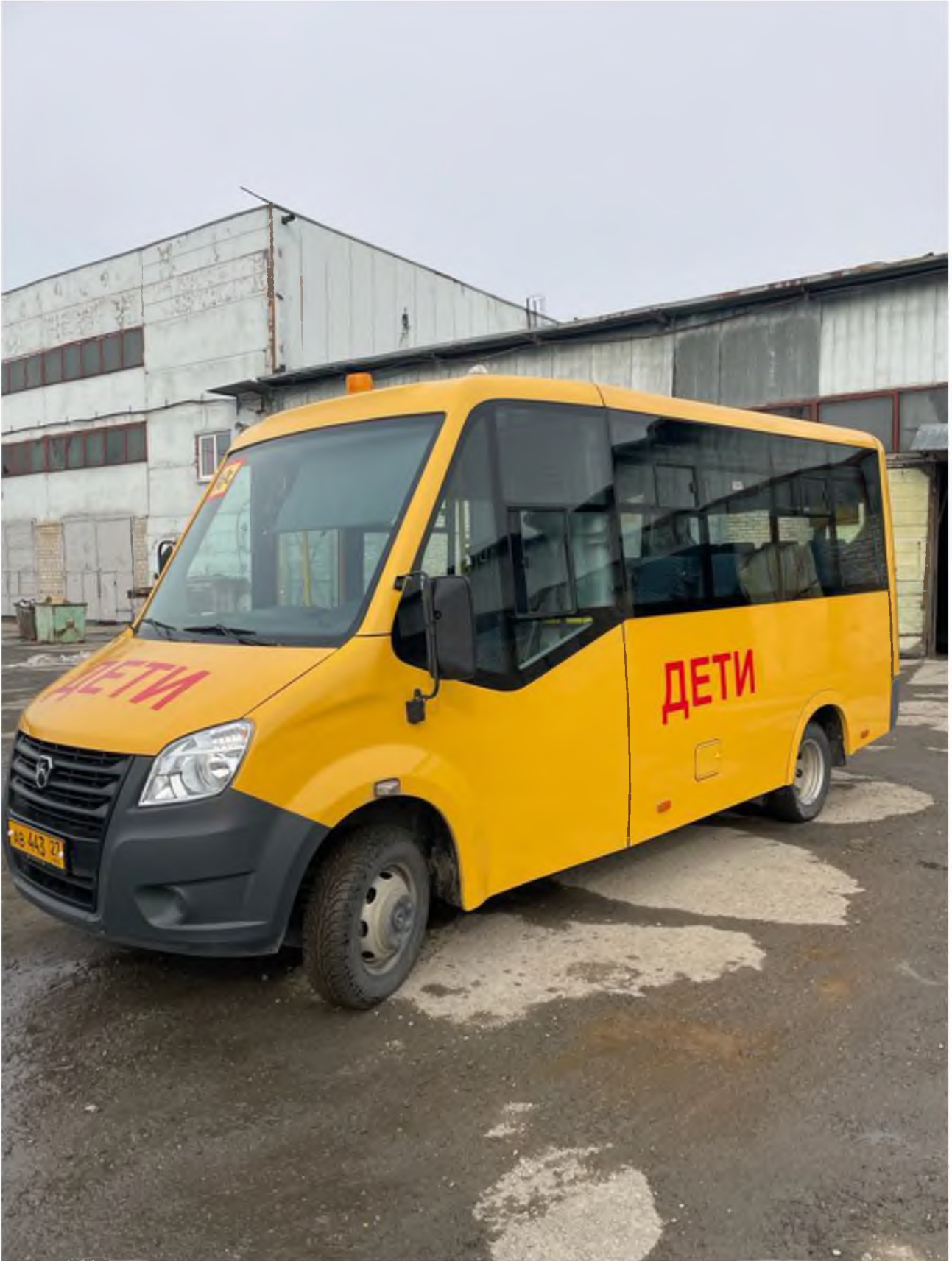
Вид сбоку (слева)